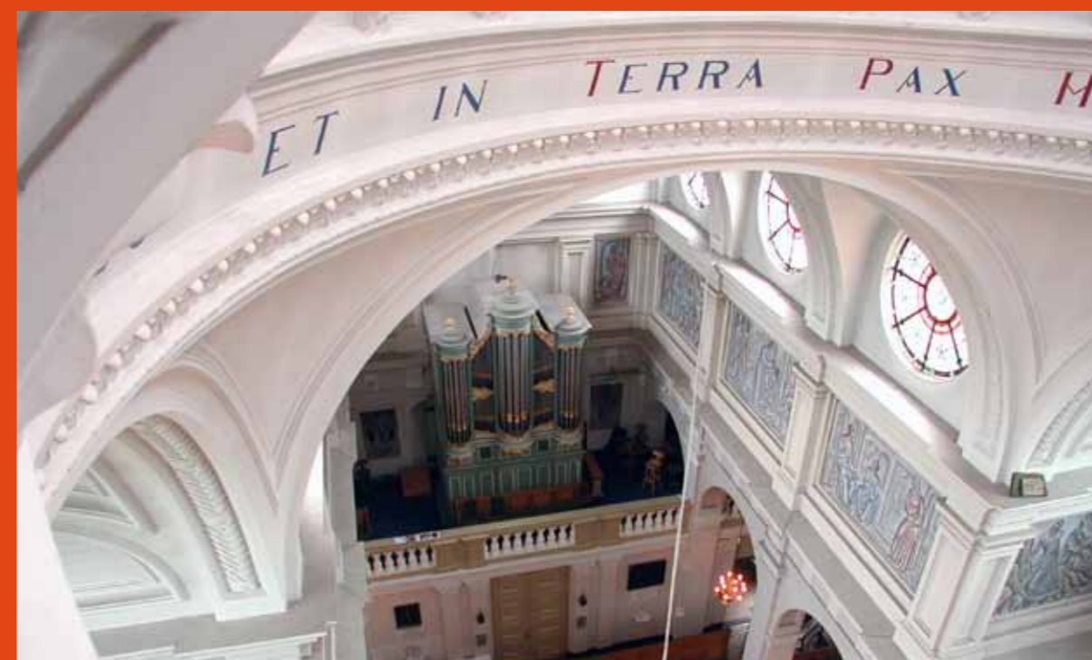
Gezicht vanuit de koepel