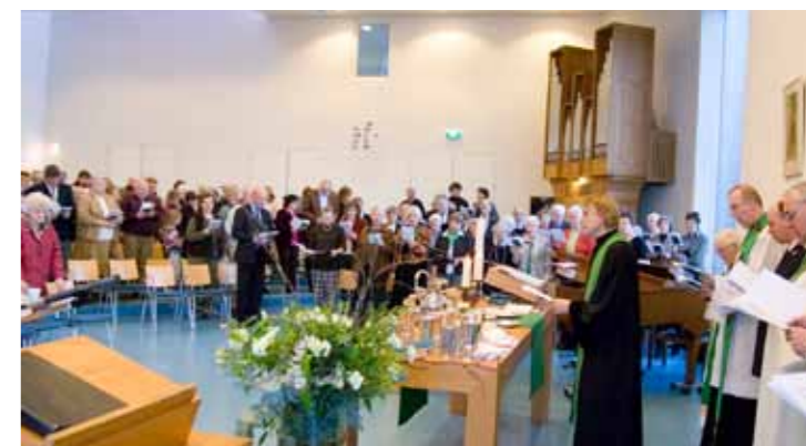
Oecumenische viering in de Regenboogkerk

Eens per jaar komen we samen met een aantal andere kerken in Hilversum in een gezamenlijke viering. Met de Regenboogkerk (PKN), de Onze Lieve Vrouwe parochie (RK) en het Leger des Heils vieren we dan in een van de kerkgebouwen samen. Zo maken we kennis met elkaars gebruiken en tradities en leren we van elkaar.