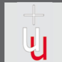
logo Unie van Utrecht

Veel katholieken in Duitsland, Zwitserland en andere landen weigerden dit nieuwe dogma te aanvaarden. Toen ze daarop werden geëxcommuniceerd, deden ze al spoedig een beroep op de Nederlandse bisschoppen, die immers reeds langer onafhankelijk waren van Rome. In 1889 sloten ze met de kerk van Nederland de Unie van Utrecht . Sindsdien is dit verband uitgegroeid en omvat het een twaalfal landskerken in Europa, de Verenigde Staten en Canada.