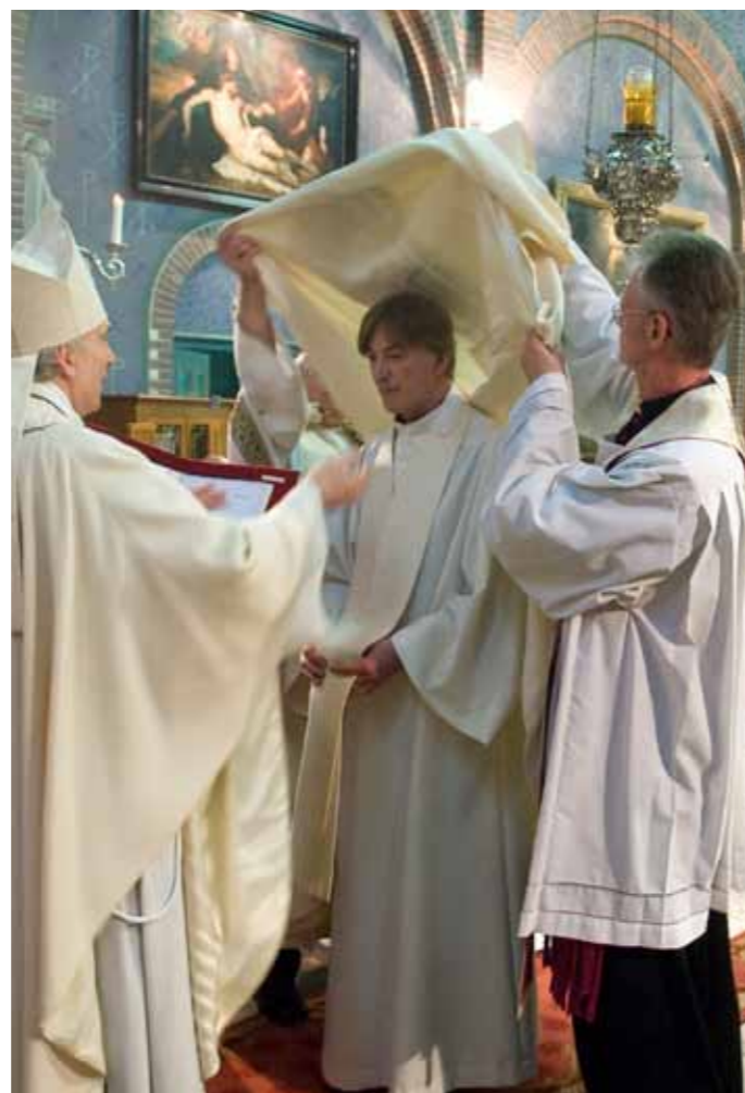
Priesterwijding in de Ste. Gertrudis, Utrecht

De oud-katholieke parochie van Hilversum is onderdeel van het aartsbisdom Utrecht (er zijn twee oud-katholieke bisdommen, de andere is het bisdom Haarlem). De kathedraal in Utrecht is de hoofdkerk van het bisdom waar de zetel van de aartsbisschop van Utrecht staat. Daar vinden de belangrijke vieringen plaats zoals wijdingen van priesters en bisschoppen en de chrismamis (zie hieronder). De kathedraal is ook de plaats voor de ontmoeting met leiders van andere kerken zoals met de aartsbisschop van Canterbury (Anglicaanse kerk) of met de patriarch van Constantinopel (Orthodoxe kerk). Zo zijn we in het bisdom niet alleen verbonden met andere parochies, maar ook met de wereldkerk.