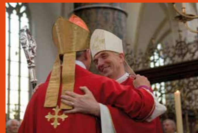
Wijding van de bisschop van Haarlem