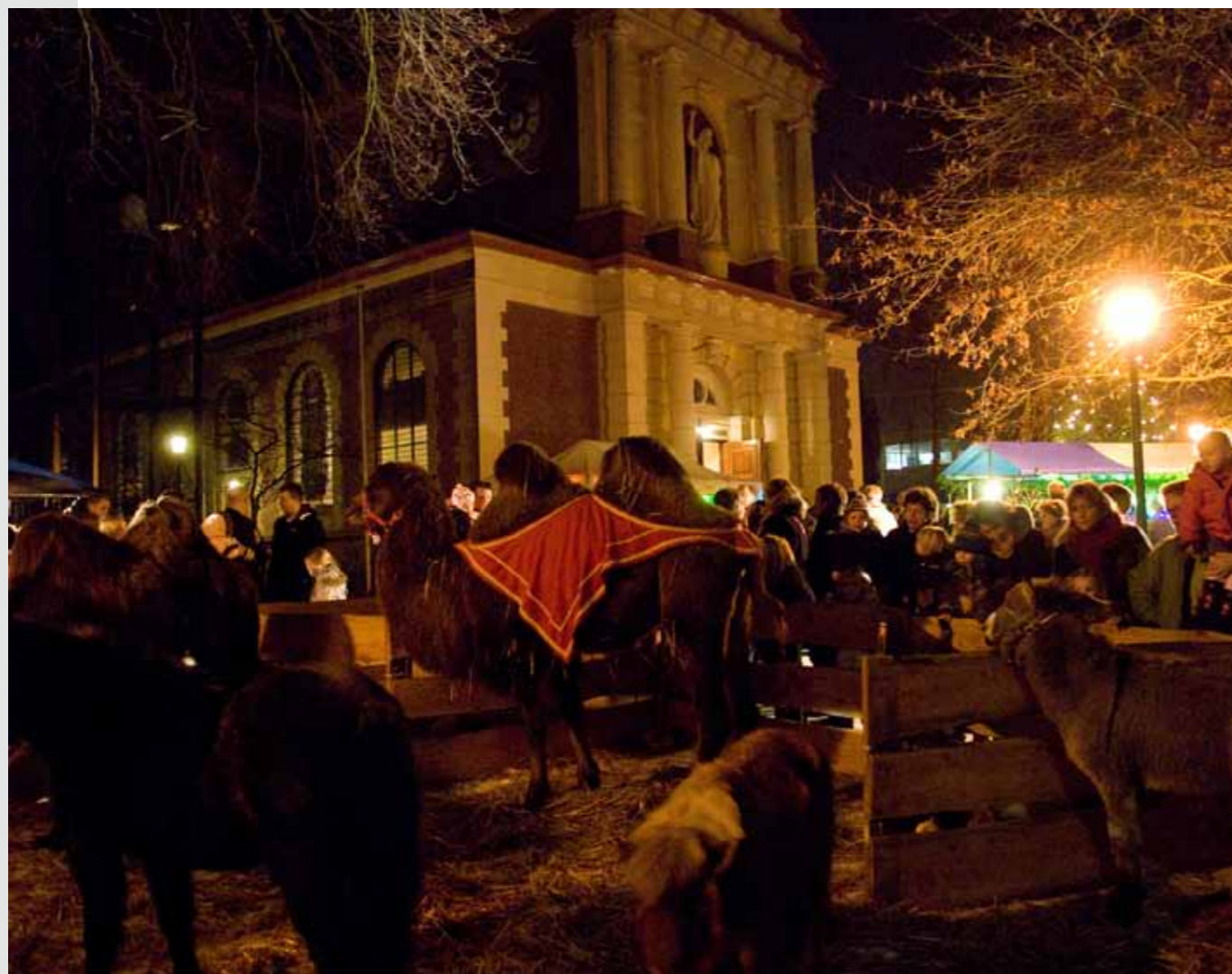
St. Vitus kerstplein

Vanaf de eerste Adventszondag leven we toe naar het Kerstfeest. Dat is te zien aan de versieringen en de kaarsen van de adventskrans die worden aangestoken. Maar ook in de lezingen en de liederen wordt steeds meer duidelijk van het verlangen dat groeit. 'De nacht loopt ten einde, de dag komt naderbij' zingen we en we steken nog een kaars aan. Want Licht, daar gaat het om. God die in Jezus heldere woorden spreekt en warme daden doet.